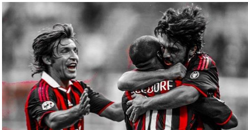
Şekil 1 ünlü orta saha oyuncuları (google)

Aynı şekilde savunma oyuncularının ve kalecinin kurtarışlarını, müdahalelerini hayranlıkla izliyor olabilirsiniz, ancak rakip takımın hücumları önce ortasahada ve kenarlardan söndürülmezse bunlar boşuna olacaktır. Özetle orta saha futbolun beynidir ve bu pozisyonda oynayan oyuncular ne kadar güvenilir ve yetkin olursa, tüm takımın oyunu o kadar güçlü ve kararlı olur. Futbol tarihine bakıldığında, özellikle de son 30 yıldaki (futbol ve taktik anlayışının değişmeye başladığı dönemlerden itibaren) futboldaki başarı çizgilerine bakılırsa başarılı takımların en önemli oyuncuları, bazen de gözlerden kaçan gizli kahramanları orta saha oyuncularındır.